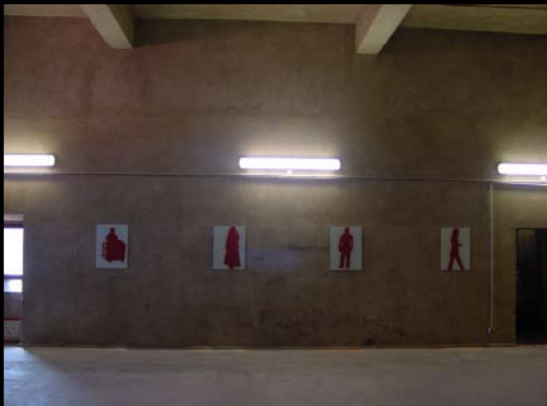
3. Turm-Halle, Dachboden: Make a Wish , 2002