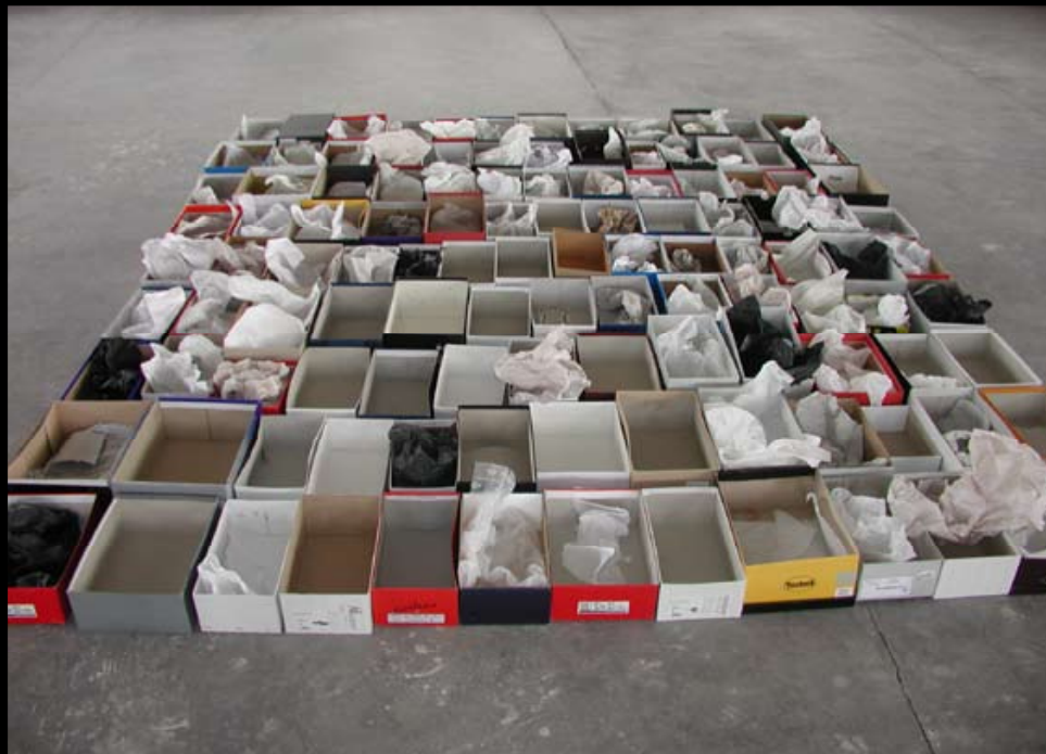
4. Turm-Halle (Turmspitze): We Have Just Left , Berlin 2002, Installation 118 Schuhkartons und Room for Rent , New York 1985, Stimmen auf Anrufbeantworter