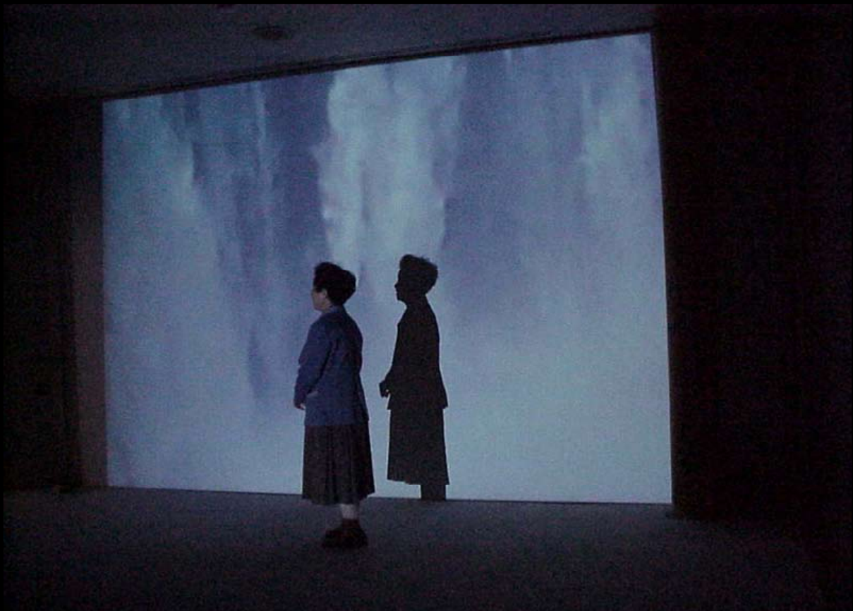
2. Turm-Halle: Falls, Zambia 1999/Berlin 2002, Konische Videoprojektion oben: 7hoursTURM Berlin 2002 | unten: Prefectural Museum Yamaguchi of Art, Japan 2000