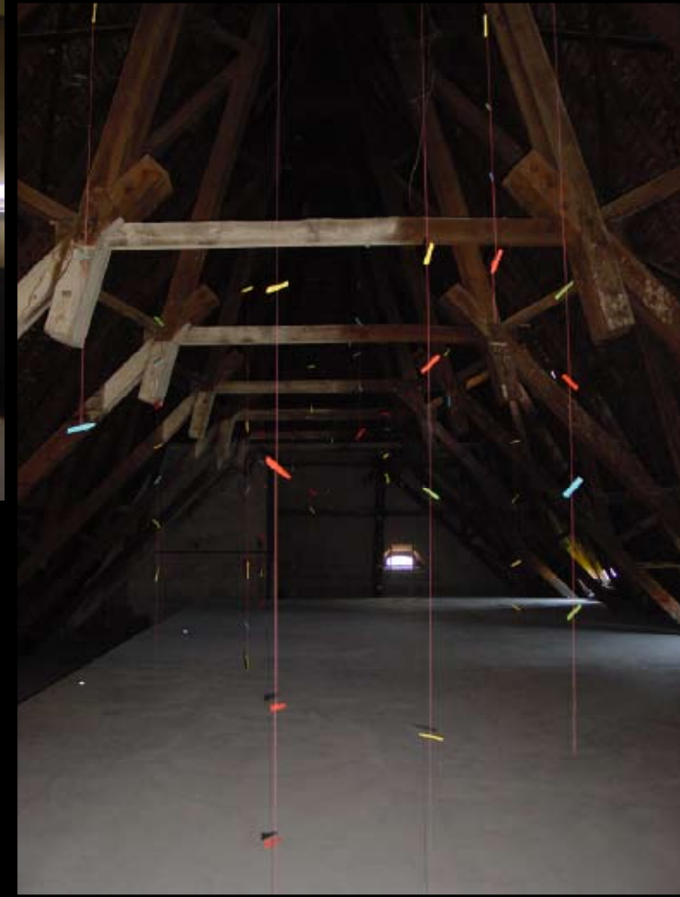
1. Turm-Halle: Red Identities , Berlin 2002