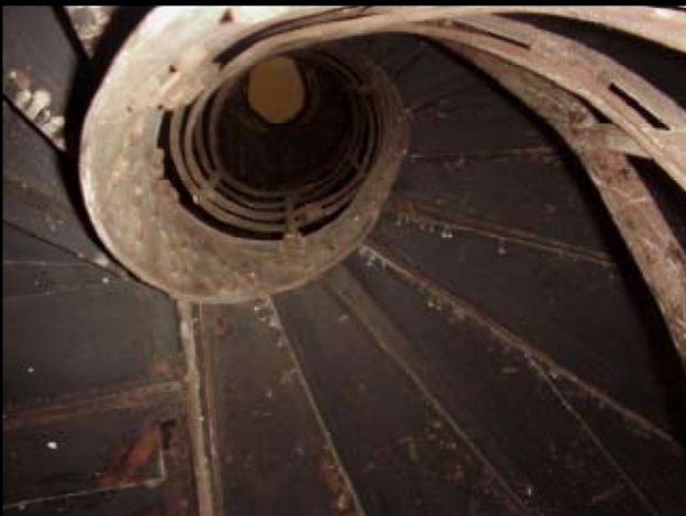
Wendeltreppe: Fast Zu II , Berlin 2002, Klanginstallation, Jörg Geismar STILLE, Berlin 2002