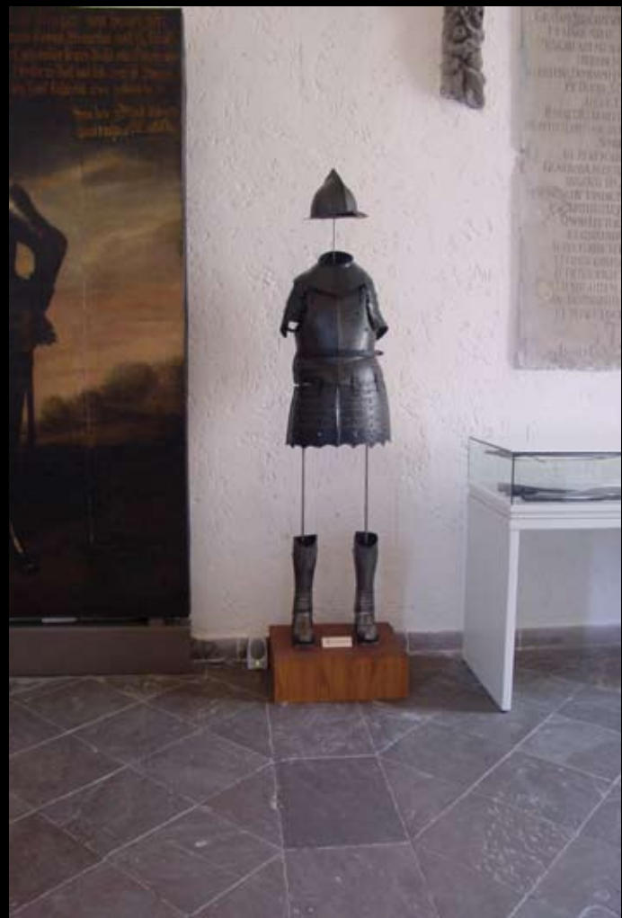
Historic Unity, Waffenhalle, 2002 | Jürg Geismar STILLE, Berlin 2002 , Fotos: Jürg Geismar Axel Nowak Historic Unity, Klanginstallation mit von Museumsmitarbeitern gelesenen Beschreibungen der Exponate in der Waffenhalle, Berlin 2002 und Video Military, Yamaguchi 2000