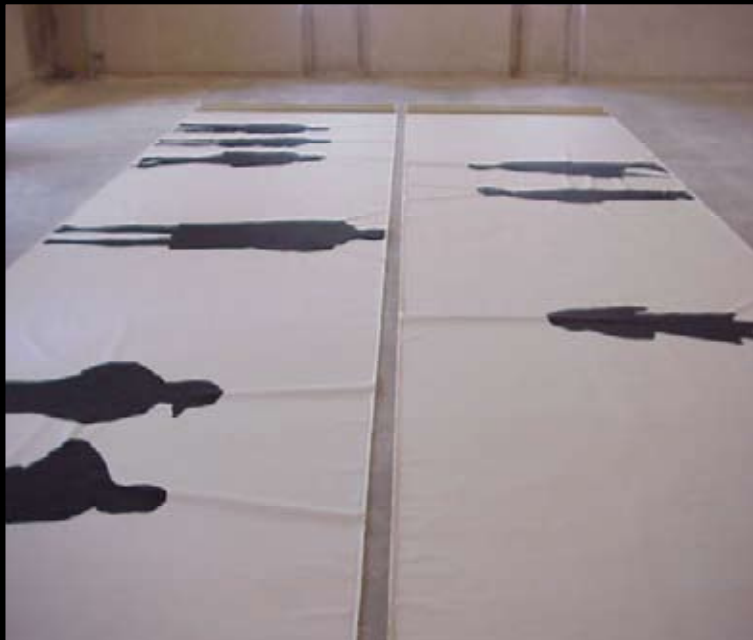
3. Turm-Halle: People's Exchange Berlin , 2002 Schwarze Wandfarbe auf Leinwand, 2 Teile, je 2,10 m x 10 m