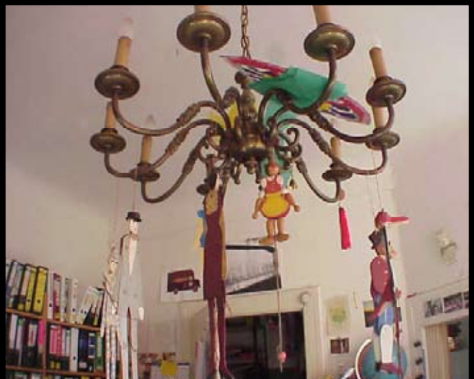
Treppenabsatz und Rahmendepot: Just at Home II, Berlin 2001/02, 80 Diapositive Fotos: Geismar, Nowak