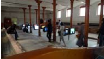
HAUS 19 Stall Agter die Berge The Joburg Fringe Video Berlin, 2011