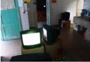
HAUS 19 Milchküche C. Newman Selected Videos 2008